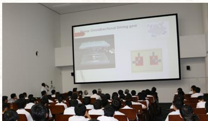
留学生による研究紹介