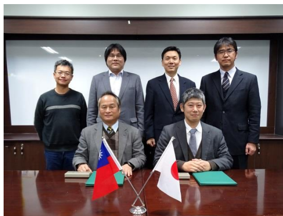
国立中央大学工学院で行われた調印式