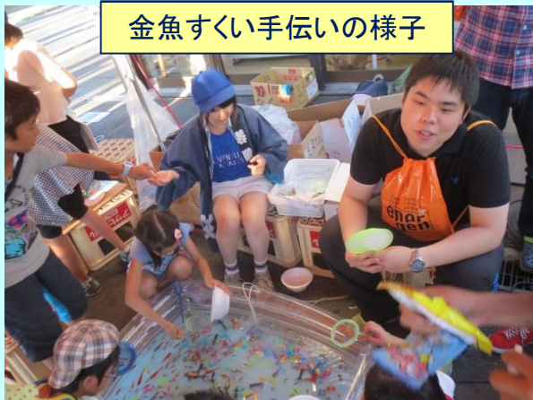
金魚すくい手伝いの様子