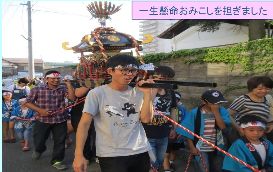
一生懸命おみこしを担ぎました

7月10日(金)米沢市あら町商店街で開催された、えびす神社夏祭りにて留学生が運営の手伝いとして参加しました。おみこしを担いだり、金魚すくい の店番を担当したり、日本ならではの経験ができ、楽しんでいる様子でした。