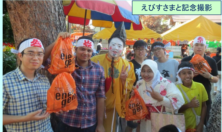
えびすさまと記念撮影